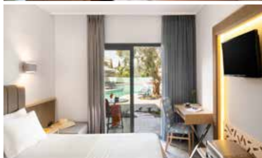
chambre vue piscine